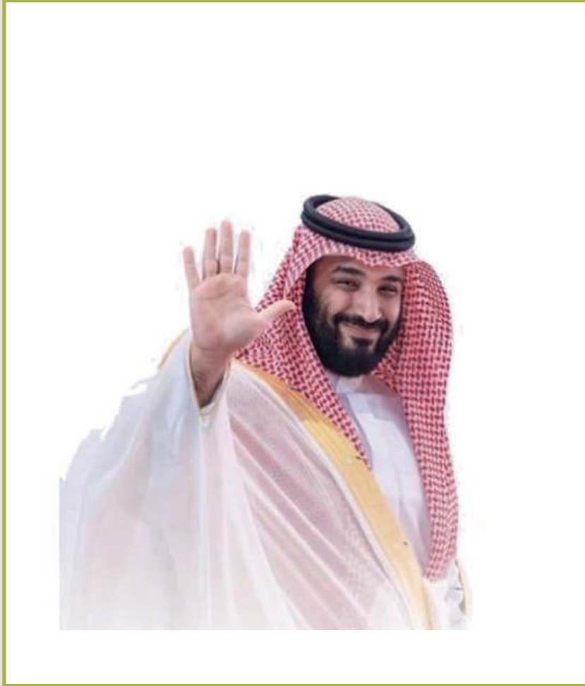
صاحب السمو الملكي الأمير محمد بن سلمان بن عبدالعزيز آل سعود ولي العهد و رئيس مجلس الوزراء حفظ الله