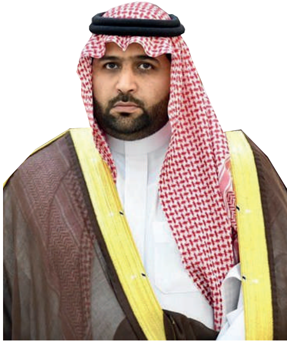
صاحب السمو الملكي الأمير محمد بن عبد العزيز آل سعود نائب أمير منطقة جازان