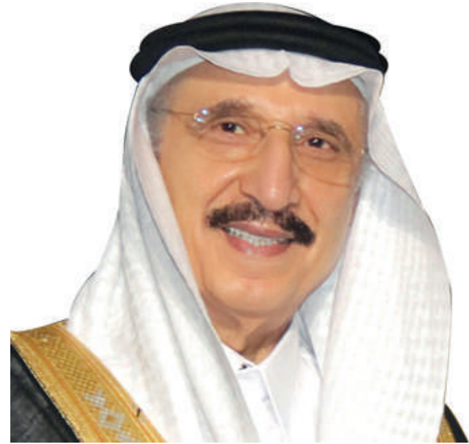
صاحب السمو الملكي الأمير محمد بن ناصر بن عبد العزيز آل سعود أمير منطقة جازان