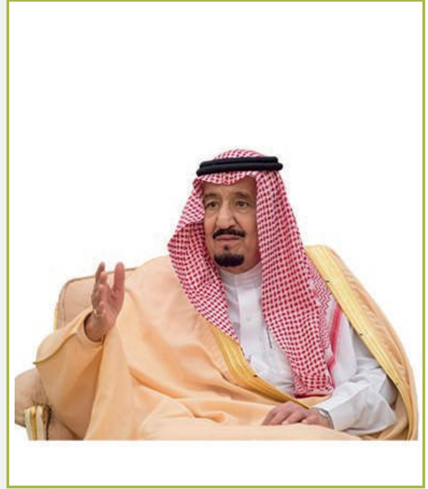
خادم الحرمين الشريفين املك سلمان بن عبدالعزيز آل سعود حفظه الله